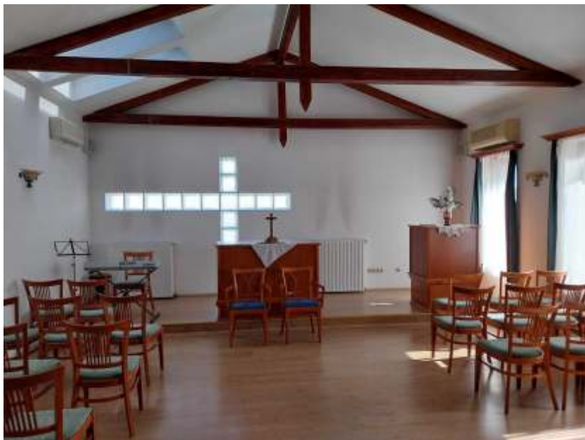
Idősek otthona- imaterem